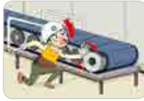
컨베이어 화물작업 중 회전 하는 체인에 맞음