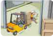
지게차, (화물)자동차 구내 운행 부주의