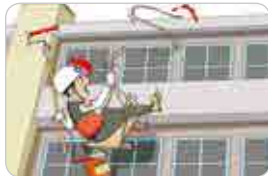
달비계를 사용하여 건물 외벽 청소에 구명줄 미설치