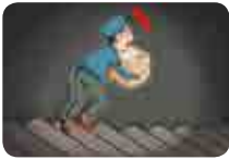
순찰, 물품운반 등 어두운 지하 계단 보행