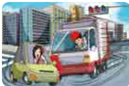
운행 중 신호위반 또는 과속