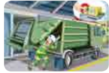
청소차량(압축진개차) 개폐장치 레버 임의조작