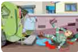
청소차량, 트럭 등 작업발판에 탑승