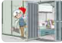
통행 중 설비 등에 부딪힘