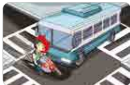
전방주시 및 확인 미흡