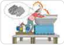
재활용 선별장 내 분쇄기· 파쇄기 작업