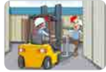
위험장소에 대한 유도자 미배치 등 안전조치 미흡