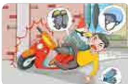
승차용 안전모 등 보호장구 미착용