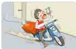
운행 중 휴대폰 통화, 한 손에 배달물을 든 채 운행하는 등 불안전한 행동