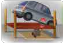
주차리프트에 차량 입고 시 임의 작동