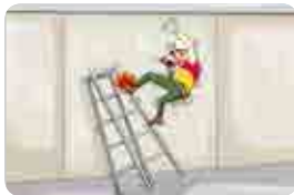
사다리 파손이나 헛디딤에 의해 실족