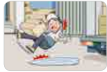
바닥 및 통로에 물기, 빙판, 기름 등 이물질