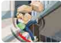
계단에서 미끄러지거나 히터며 넘어짐