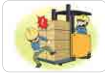
운반설비로 중량물 이용 시 취급 부주의