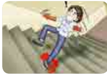
계단청소 중 부주의