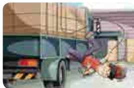
화물차량 적재·포장작업, 건축물 옥상, 단부 등 높은 곳에서의 불안전한 작업